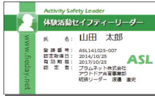
体験活動セーフティーリーダー (ASL)